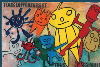
Tous différents et tous ensemble - Affiche lauréate de l'édition 2011 Ecole maternelle Paul Bert, 89400 Migennes

Dans cette approche, l'action éducative favorise à la fois la réussite scolaire et l'insertion dans la société. Elle puise sa richesse dans la diversité et dans la qualité des loisirs éducatifs et se développer grâce à un réseau de structures éducatives de proximité : centres de loisirs, multi-accueils, clubs de jeunes.